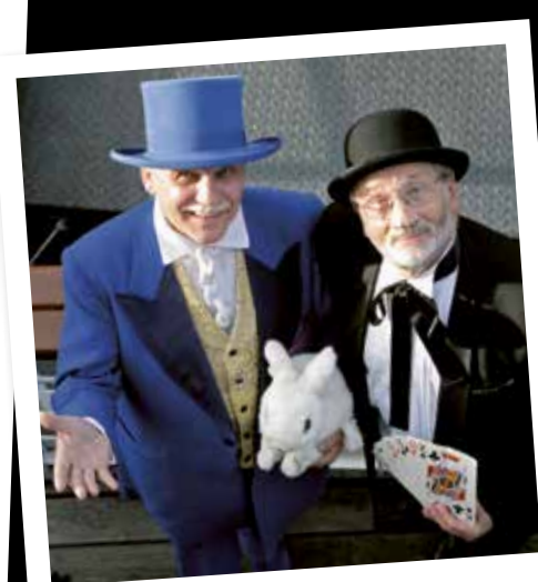
TABLE MAGIC, ILLUSIE & MINDREADING